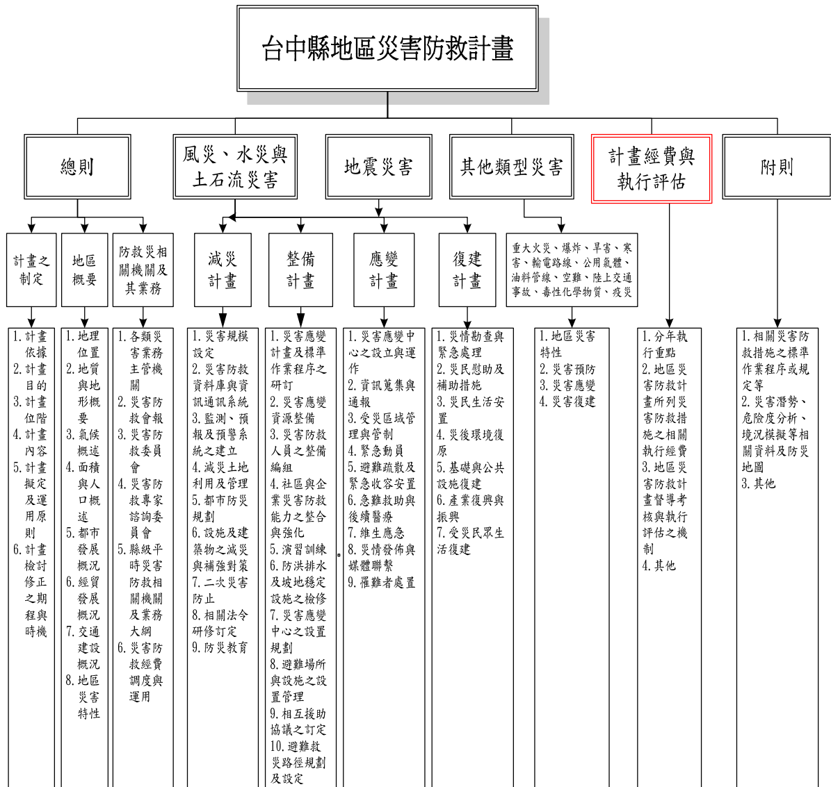
圖 1.1.1 台中縣地區災害防救計畫架構圖